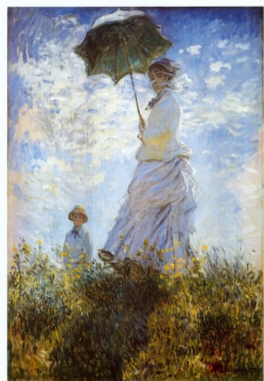
La Promenade ou La Femme à l'ombrelle , 1875, 100x81, Washington, National Gallery of Art.