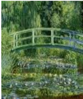
Le Bassin aux nymphéas , 1899, 89,5 x 92,5, Paris, Musée d'Orsay.